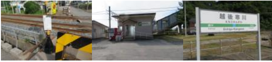
※浜道踏切、越後寒川駅