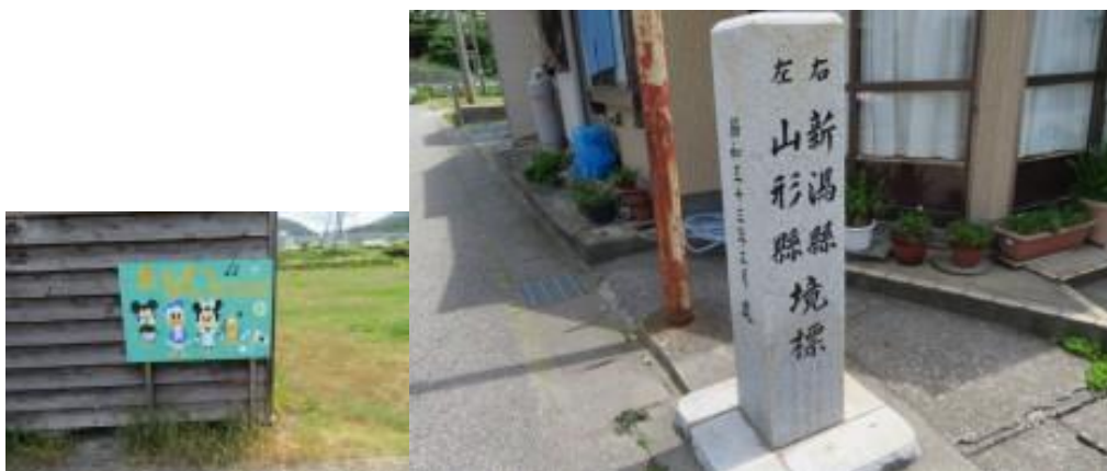
※鼠ヶ関駅界限、山形県・新潟県境標

③11時12分、日本海の塩”白いダイヤ”前を通過。12時2分、JR線下を潜り鉄道の左側となる。12時4分、152歩ある大川橋を渡る。12時15分、造船所踏切界限で秋田行きの特急電車(ピンク色)が通過して行く。特急停車駅の府屋駅には12時21分到着。この駅には貨物の基地もあった。