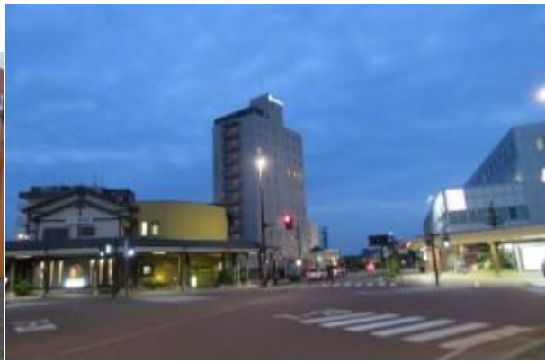
※本田屋、新発田第一ホテル