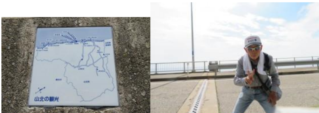
※粟島を背後に記念写真