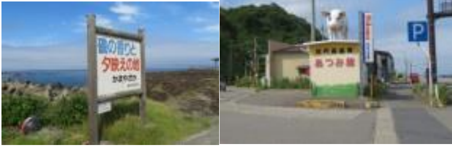
※磯の香りと夕映え地” かまやざか”、あつみ豚