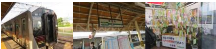
※越後寒川駅、新発田駅

⑥16時13分の新津行きで新発田駅まで移動する。村上駅から通学帰りの沢山の高校生が乗車して来る。本日から4日間お世話になる新発田第一ホテルには17時47分到着。チェックアウト後、ホテル界隈の本田屋で祝杯をあげる。